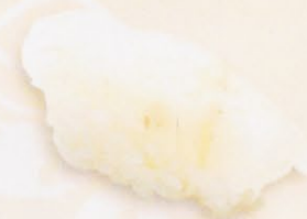
28 Hirame 平目 € 5,00