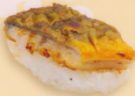
33 Unagi 鰻 € 5,50