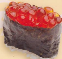
34 Ikura いくら market price