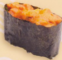
36 Uni うに market price