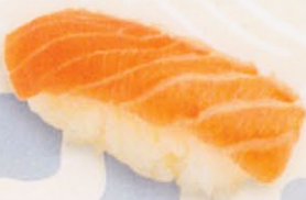
26 Shake 鮭 € 5,00