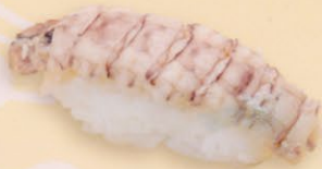
37 Shako 蝦蛄 market price