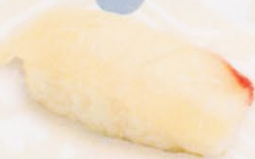
27 Tai 鯛 € 5,00