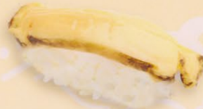
38 Awabi 鮑 market price