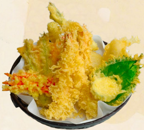
50 Tempura groß