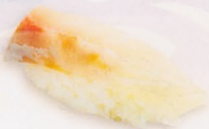
29 Suzuki 鱈 € 5,00