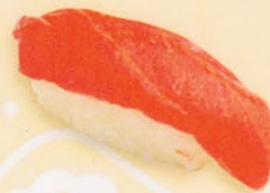
35 Toro とろ € 8,00