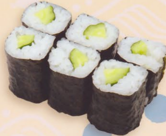
14 Kappa かっぱ巻き € 5,00