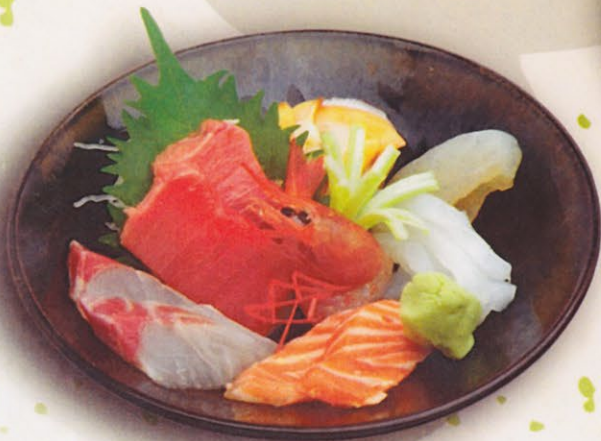
42 Sashimi, klein