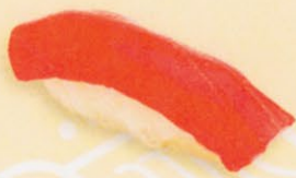
31 Maguro 鮪 € 6,00