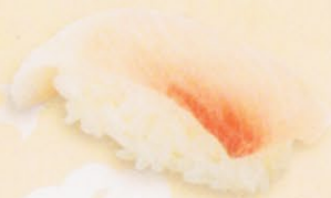
21 Kanpachi かんぱち € 6,00