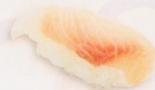
32 Hamachi はまち € 6,00