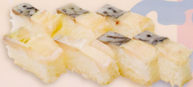
17 Battera ばってら € 20,00