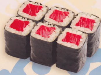
15 Toromaki とろ巻き € 9,00