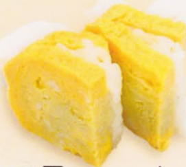
24 Tamagoyaki 卵焼き € 3,00