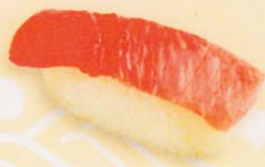
35 Chu-Toro 中とろ € 8,00