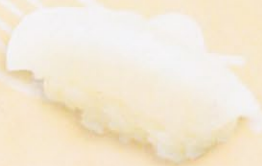
20 Ika いか € 4,00