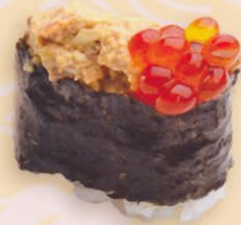
39 Kani 蟹 market price