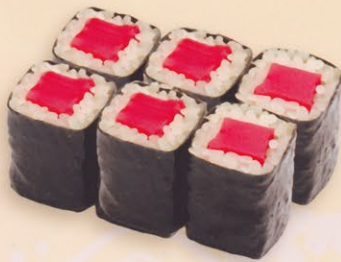
13 Tekka 鉄火巻き € 8,00