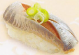
23 Iwashi 鰯 € 3,00