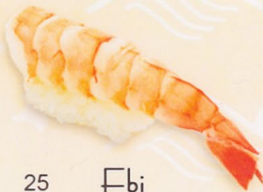
25 Ebi 海老 € 5,00