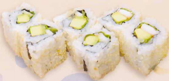
16 Californiamaki カリフォルニア巻き € 10,00