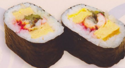
18 Futomaki 太巻き € 20,00