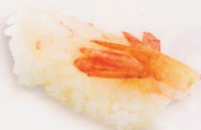
30 Amaebi 甘海老 € 5,00